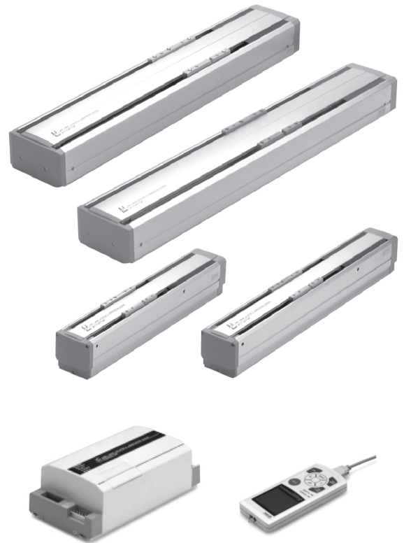
Контроллер серия LC1